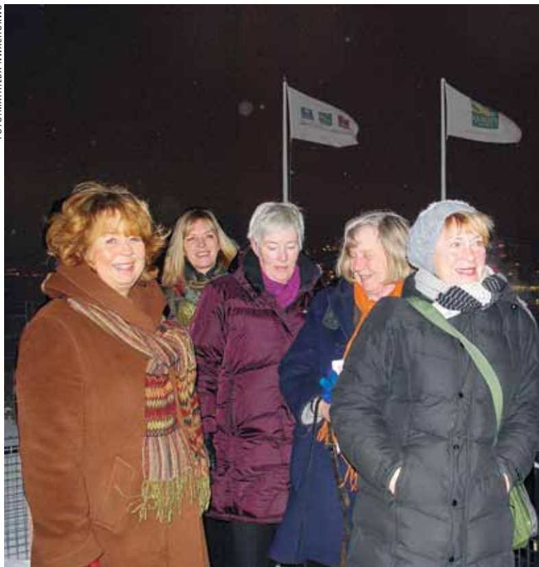
lvrar för gemenskap. Föreningen "Under samma tak" hoppas kunna flytta in i ett gemensamt bostadsområde på stranden i Göteborg inom fem år. En inspirationskälla för föreningen är kollektivhuset i Göteborg.

Målet för "Under samma tak" är att ha ett hus med omkring 40 lägenheter. Kooperativ hyresrätt, ett mellanting mellan hyresrätt och bostadsrätt, ser de som mest passande då gruppen själva vill ha kontroll över in- och utflytningar.