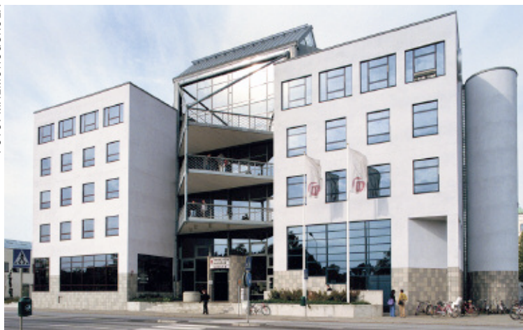
En internationell konferens om gemensamhetsboende äger rum på Malmö Högskola våren 2010.

ämnet genom att visa att Sverige har något som väcker intresse i andra länder