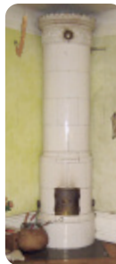
Kakelugn ger värme i alla lägenheter.

komma tillbaka till 70-talet. En liten lägenhet på ett rum och kök där två vuxna bor och varannan vecka finns två barn i hushållet. I köket finns en vedspis men även en modern gasspis. Där värmer man vatten till disk. Det gamla skafferiet har behållits. En liten toalett finns, men duscha får man göra i källaren. Hyresgästerna delar på duschtrymmen som finns på våningsplanet eller i källaren. Det gäller i en del fall även toaletter.