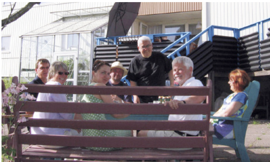
Kollektivhuset Tunnan i Borås hade 250 besökare på Öppet hus. Bilden är tagen när styrelsen i Kollektivhus NU besökte Tunnan.

Ibland var det kaffe och bulle, eller loppmarknad, som drog intresserade. Men de allra flesta kom för att sätta sig in i vad det innebär att bo i en bogemenskap, eller för att få veta hur man gör för att bli med. Kollektivhus NU:s tradition att ordna öppet hus är ett viktigt instrument att minska fördomarna om och öka intresset