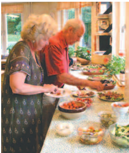
Trygghet och gemenskap i Färdknäppen på Södermalm i Stockholm.

I valrörelsen talar Göran Persson samtidigt om de äldre och om att satsa på att bygga bostäder för de som är hyfsat friska men som känner sig ensamma. Varför inte satsa på fler kollektivhus som ett sätt att bryta isolering och ensamhet, tycker Kollektivhus Nu.