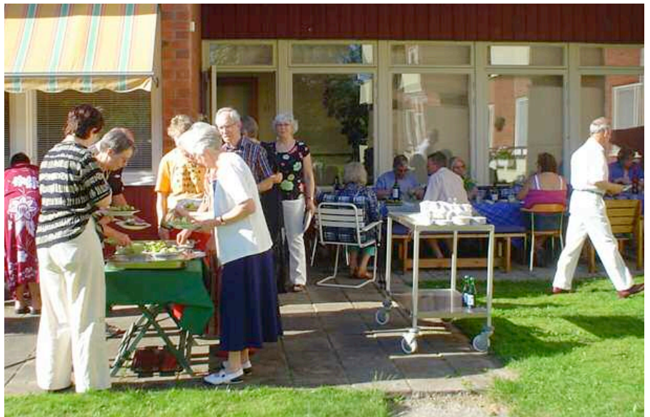
Sommarmiddag på terrassen på Tersen i Falun.