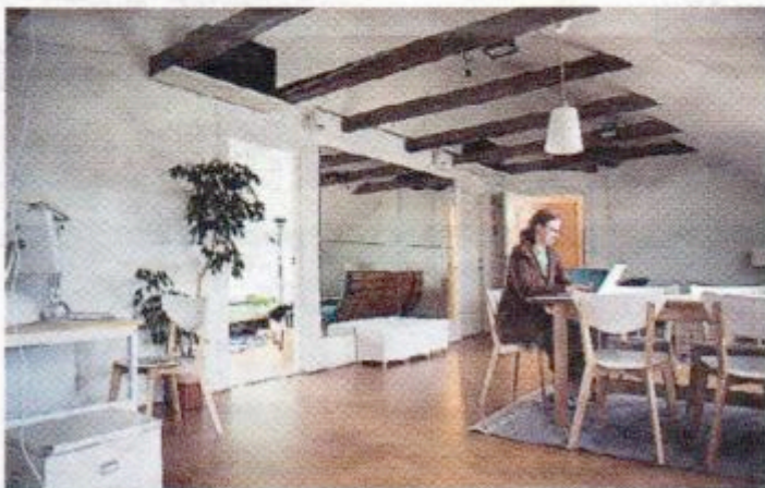
Extrarum. På vinden finns ett större allrum som kan användas efter behov. Studenten Ulrike Deppert brukar sitta och skriva vid det stora träbordet.