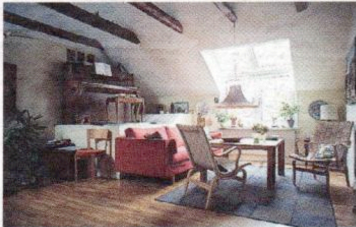
Ett rum med utsikt. Pionjärerna Ulla och Lennart Nord har den största lägenheten, en femma, som ligger högst upp i huset. Klara dagar kan de se Domkyrkans spiror.