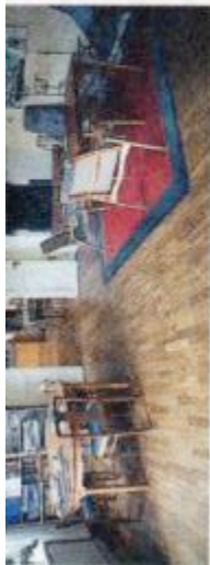
Gemenskap. I anslutning till köket ligger det gemensamma vardagsrummet. Här läser man, spelar brasa och umgås. De stora ytorna uppskattas av barnen i huset.