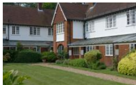
Den gemensamma innergården i Sollershot Hall, fd Homesgarth. Glastak över gångvägarna efter fasaderna så man kunde gå torrskodd till matsalen.