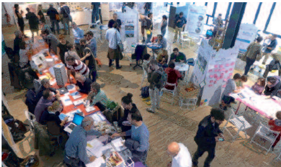
25 utställare visade projekt, stadsträdgårdar, planeringsmetoder och ännu fler projekt.