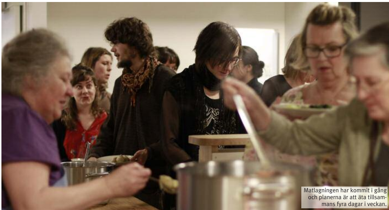
Matlagningen har kommit i gång och planerna är att äta tillsammans fyra dagar i veckan.

småprata litet när de möts. Hon anser att människor mår bra av att ha gemenskap.