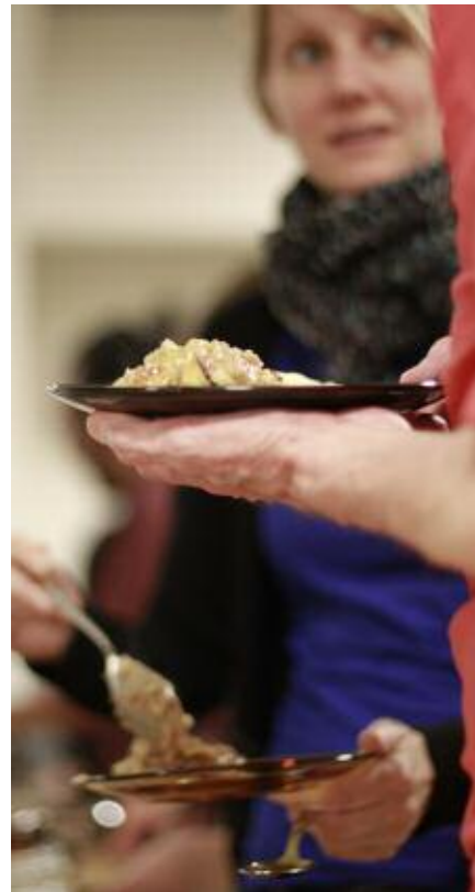
Kollektivhuset Sofielund är i gång och invånarna håller på att sätta sin prägel på sitt hus.

ren närmar sig i Skåne. Det gemensamma storköket med matsal, och den inglasade loggian med direktkontakt med gården, imponerar. Bland de många arbetsgrupperna finns en inredningsgrupp som säkert har mycket att göra. Matlagningen har kommit igång, och planerna är att äta tillsammans fyra dagar i veckan. Då och då ska det också bli en festligare måltid.