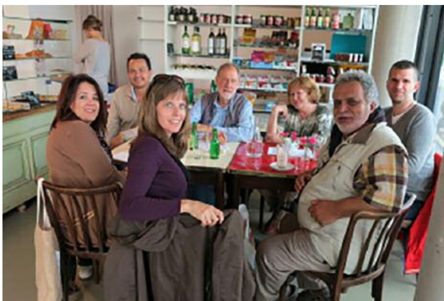
Bland de boende, i kollektivhusets kafé.