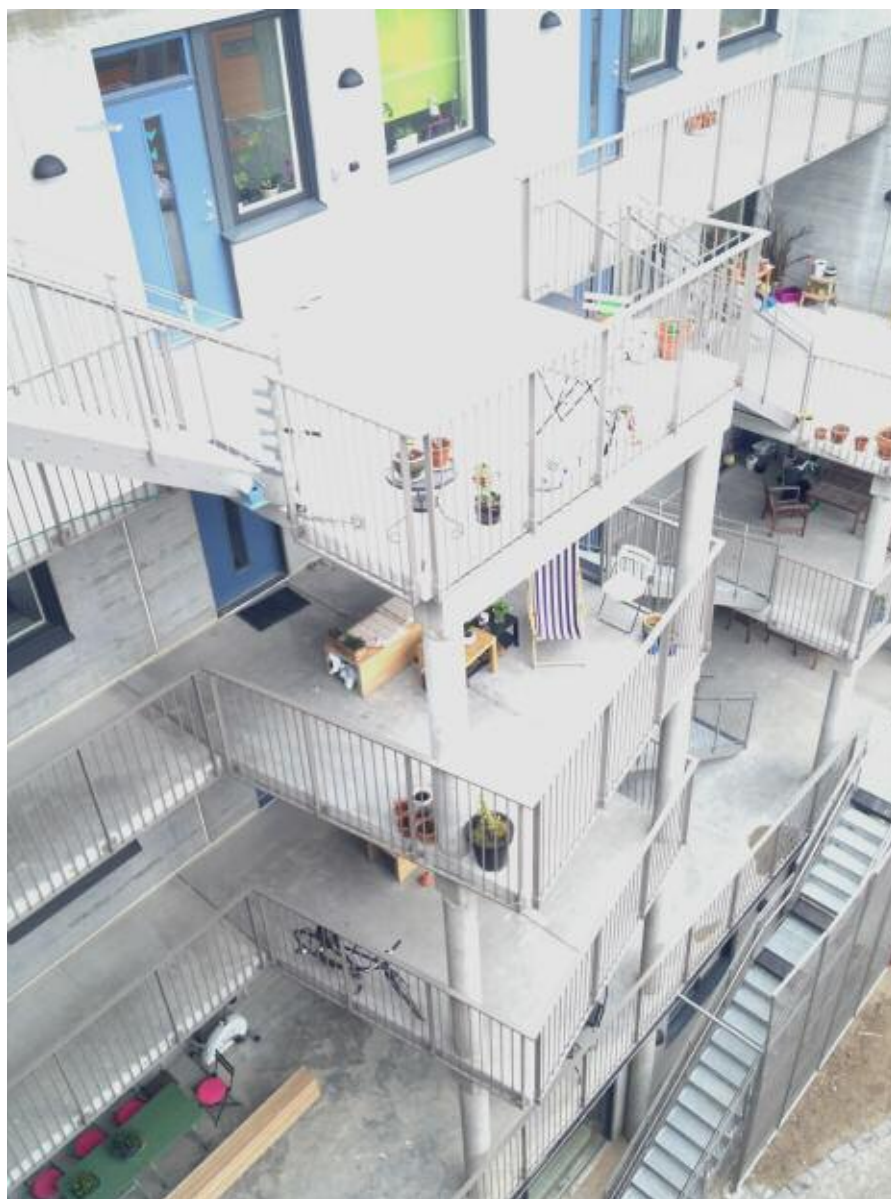
Huset är fem våningar högt, med loftgångar och uterum mot gården.