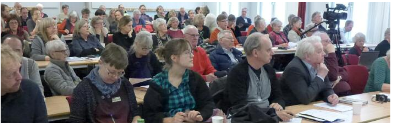
Bortåt hundra deltagare deltog engagerat i seminariet.