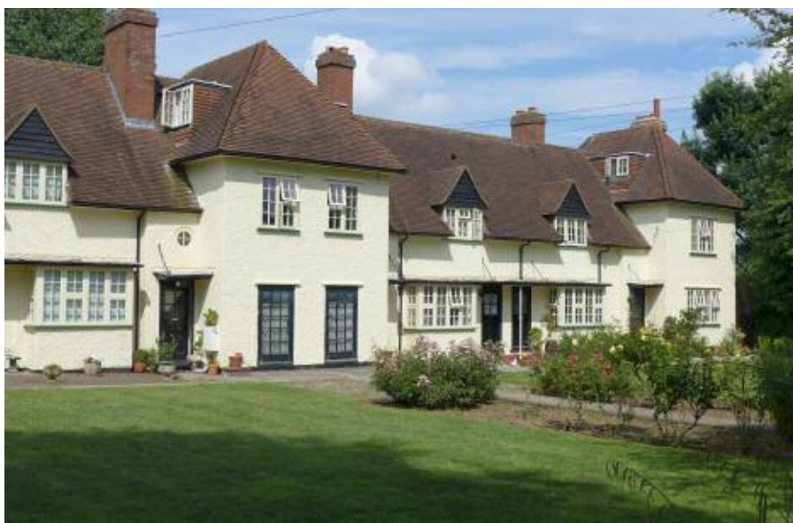
Meadow Green Road North, inflyttat 1914 och väl fungerande fram till 1976. Kök och matsal fanns i bottenvåningen bakom de stora fönstren. Numera en lägenhet.